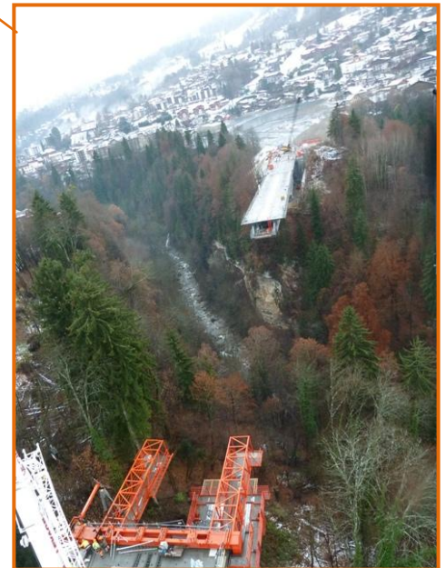
Rive droite : démontage de G2, équipement remonté