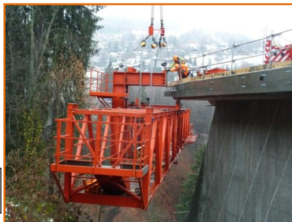
Fléau est : pose du treillis extérieur sud